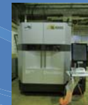
C ワイヤ放電加工機